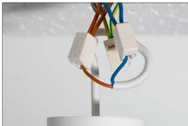
Installation rapide et démontage possible des équipements avec les bornes HelaCon Lux.