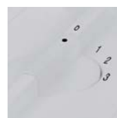
Sélecteur de vitesse.