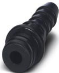
Connecteur mâle pneumatique, pour module HC-M-PN3, diamètre intérieur du flexible 4,0 mm

Remarque : les données indiquées ici sont tirées du catalogue en ligne. Vous trouverez toutes les informations et données dans la documentation utilisateur. Les conditions générales d'utilisation pour les téléchargements sur Internet sont applicables. ( http://phoenixcontact.fr/download )