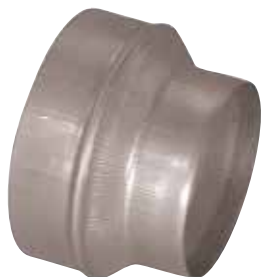
Réduction Conique Concentrique en aluminium

La RCC alu permet de raccorder deux conduits aluminium de diamètres différents entre eux.