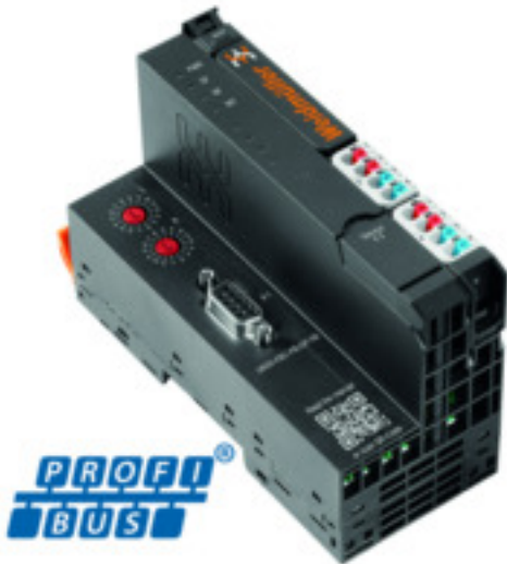
Illustration du produit, Similaire à l'illustration