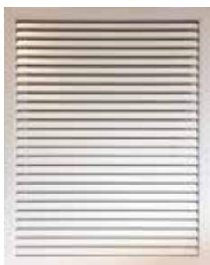
Grille de reprise T.One® AquaAIR/T.One® AIR