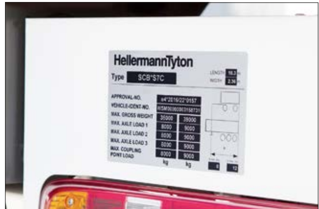
Plaque signalétique d'une remorque avec une étiquette de protection