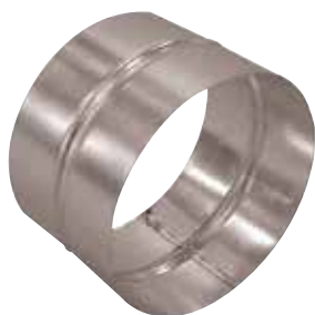
Raccord Femelle en aluminium

Le raccord femelle alu permet de raccorder deux accessoires aluminium entre eux.