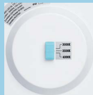
Inter pour température de couleur