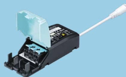
Connecteur + driver intégrés