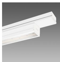
6602 Techno System - asymétrique double 25° - CRI 90