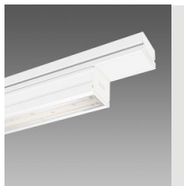
6613 Techno System HE - asymétrique double 25° - CRI 80