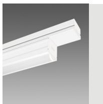
6605 Techno System - diffuseur hémisphérique extensif - CRI 90