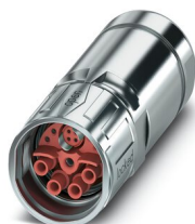
Écrou moleté pour prolongateur de câble M23 Hybrid

Veillez tenir compte du fait que les données affichées dans ce document PDF proviennent de notre catalogue en ligne. Vous trouverez les données complètes dans la documentation utilisateur. Nos conditions générales d'utilisation des téléchargements sont applicables.