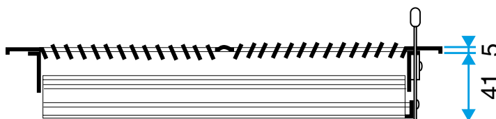
Grille SR 356