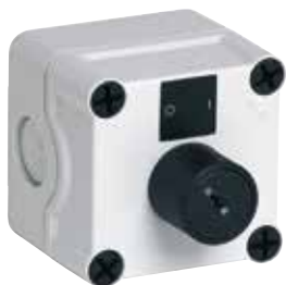
Boîtier de réarmement AXONE