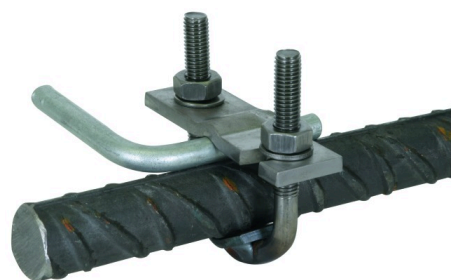
Illustrations sans engagement