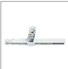
Jonction en T blanche TECTON T-VT2 WH 22157278