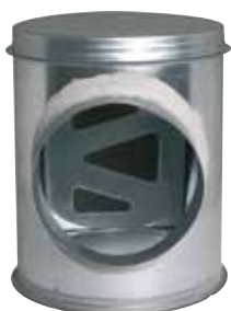
Caisson Piquage Acoustique et Aéraulique

Le CP2A assure la jonction et l'accessibilité du réseau collecteur vertical et du réseau horizontal en améliorant l'acoustique et l'aéraulique.