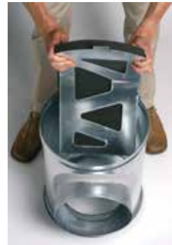
Installation du déflecteur acoustique et aéraulique dans le caisson piquage