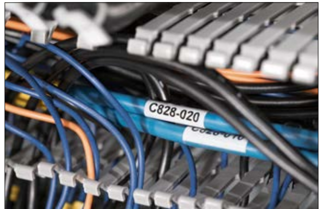
Les étiquettes Helatag 1209 offrent une excellente protection contre l'abrasion et les intempéries.