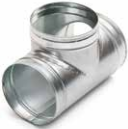
Té Equerre 90°

Le TE 90° permet de raccorder deux branches de réseau galvanisé avec un angle de 90°.