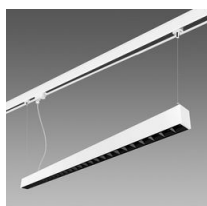
Raccord en suspension pour rail