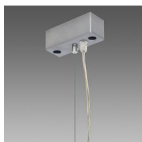
Suspension électrifiée Q