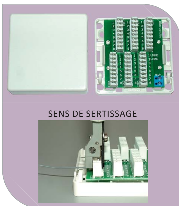
SENS DE SERTISSAGE