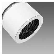
Diffuseur à ventelles