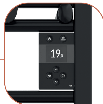
Boîtier de commande digital