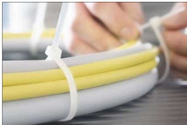
Colliers réouvrables de la série RELK en application.