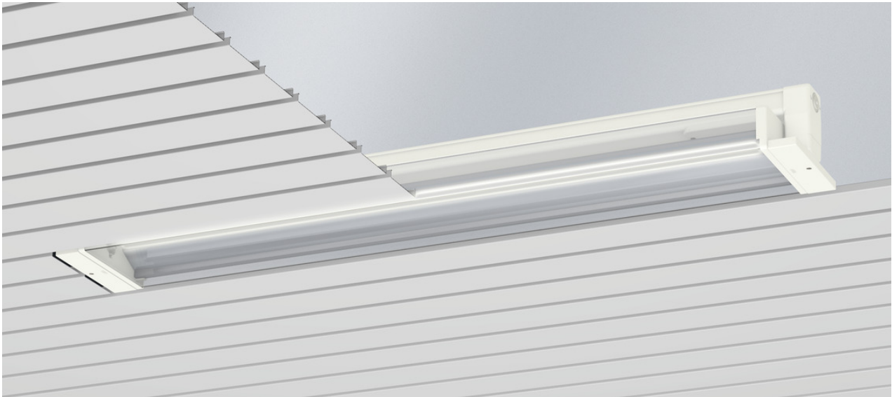
L'illustration peut différer