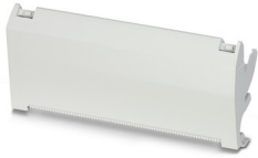
Tôle de démolition

https://www.phoenixcontact.com/fr/produits/0801803