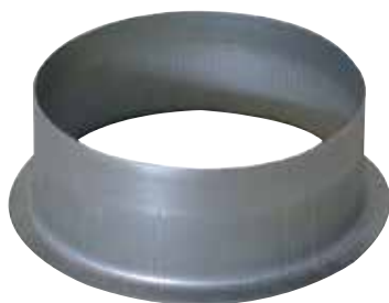
Piquage Equerre sur Plat 90°

Le piquage équerre sur plat permet de réaliser un piquage à 90° sur un conduit de type oblong ou rectangulaire galvanisé.