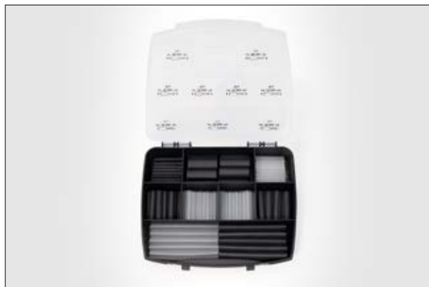
Shrinkit 321-A Basic - 130 pcs Assortiment de gaines thermorétractables 3:1 avec adhésif.