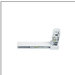
Jonction en L blanche TECTON T-VL2 WH 22157274