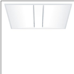
Luminaire encastré Lumière douce MLinf EL LED3600-840 M600Q LDO KA WH 42184770