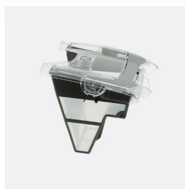
Bac filtrant (3L) débris fins 100 microns