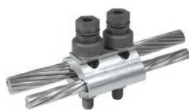
PGA 302 GCF