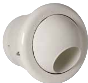
AR 190 THERMO D200 RAL9010-85%

L'AR 190 Thermo est un diffuseur à longue portée pour la diffusion d'air dans les bâtiments tertiaires avec une grande hauteur sous plafond.