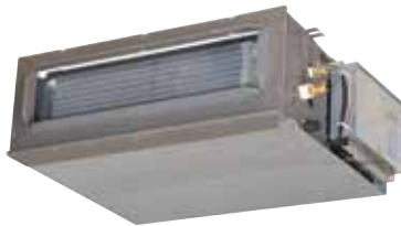
T.One® Horizontal 10 réversible

La solution innovante et sur-mesure pour se chauffer ou rafraîchir son logement confortablement.