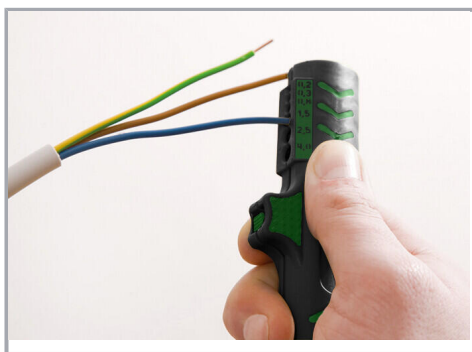
Dénudage de l'isolation du fil