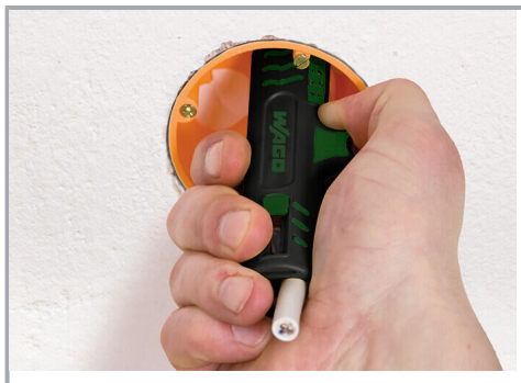
Dénudage de la gaine de câble

Sous réserve de modifications. Veuillez tenir compte de la documentation du produit !