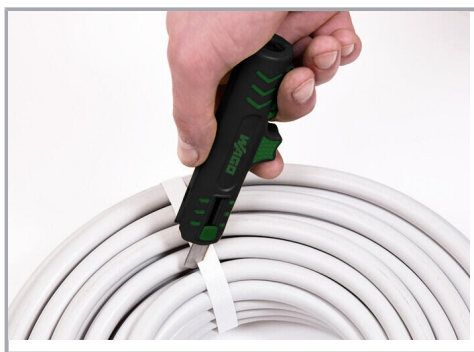
Couteau pratique intégré