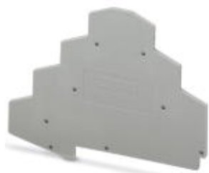
Flasque d'extrémité, Longueur: 98,5 mm, Largeur: 2,2 mm, Hauteur: 73 mm, Coloris: gris

Remarque : les données indiquées ici sont tirées du catalogue en ligne. Vous trouverez toutes les informations et données dans la documentation utilisateur. Les conditions générales d'utilisation pour les téléchargements sur Internet sont applicables. ( http://phoenixcontact.fr/download )