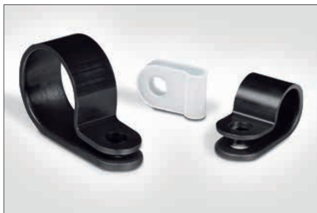
Brides plastiques à visser de la série HP.