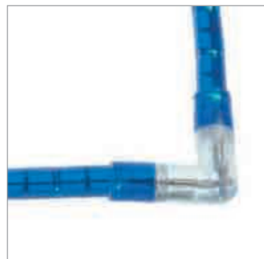
NLC51L Connecteur en L à coller

Le kit comprend : 1 alimentation caoutchouc de 1 m avec prise et connecteur polarisé + pont redresseur AC/DC incorporé, 1 pique d'alim, 1 spin's complet, 1 pot de colle et 1 embout.