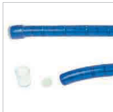
NLC54-12 Embout isolant collable