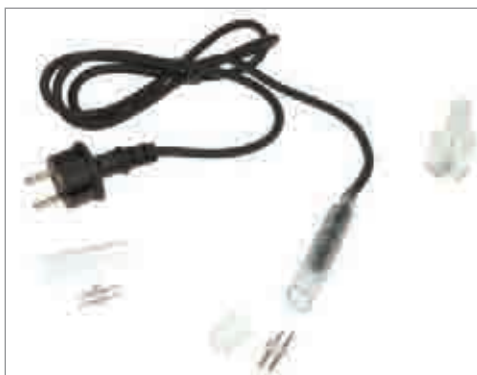
NLC95-12 Kit d'alimentation pour fil lumière® LED

Le kit comprend : 1 alimentation caoutchouc de 1 m avec prise et connecteur polarisé + pont redresseur AC/DC incorporé, 1 pique d'alim, 1 spin's complet, 1 pot de colle et 1 embout.