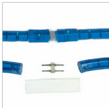
NLC92-12 Connecteur normalisé «spin's» central, collable