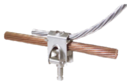
CM .. US