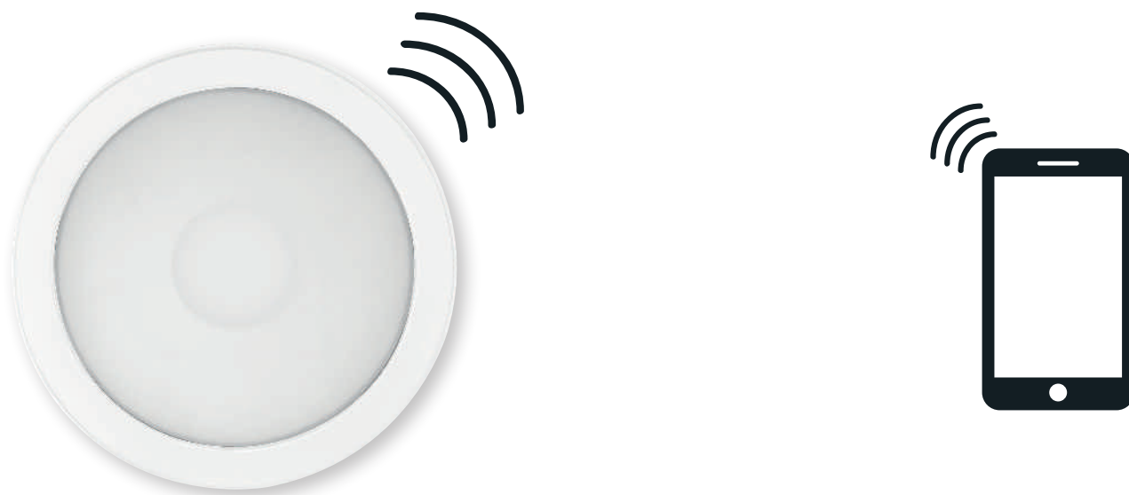
TABLEAU DES FONCTIONNALITÉS