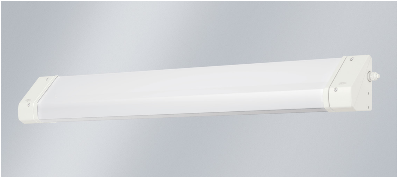
L'illustration peut différer