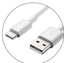
Livré avec un Câble USB / USB-C