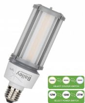
145400 LED Corn Switch E27 12W-18W-27W 1400lm-3300lm 3000K-5000K