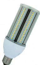
80100036285 LED Corn HOL E27 20W 2860lm 4000K