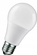
145630 LED Industry A60 E27 9.5W (83W) 1200lm 840 100V-260V AC/DC