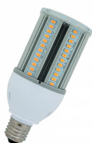
80100036284 LED Corn HOL E27 12W 1620lm 3000K