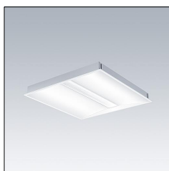
Optique à efficacité plate (MPT) IQ BEAM 3000-840 MPT HF Q600 96634274