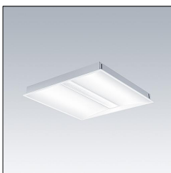
Optique à efficacité plate (MPT) IQ BEAM 3000-840 MPT HF Q600 96634274

La présente déclaration de produit environnemental (EPD) est basée selon les normes EN ISO 14025 et EN 15804 et décrit les impacts spécifiques environnementaux du produit mentionné. Cette déclaration fait suite également aux exigences spécifiques et concrètes du programme Institut Bauen und Umwelt e.V. (IBU) selon les règles de calcul des LCA et le contenu de l'EPD (de base) selon les instructions de PCR sous-jacentes (PCR: Règles de catégorie de produit) pour «Luminaires, lampes et composants pour luminaires» (Ref: IBU PCR Teil A et B). Le produit décrit sert d'unité déclarée. La déclaration inclut une description du produit, des informations sur la composition des matériaux, la production, le transport, la phase d'utilisation, l'élimination et le recyclage, ainsi que les résultats de l'évaluation du cycle de vie. Les EPD des produits de construction sont comparables uniquement si les valeurs sont calculées conformément au même PCR et des scénarios d'utilisation appropriés et obligatoires.