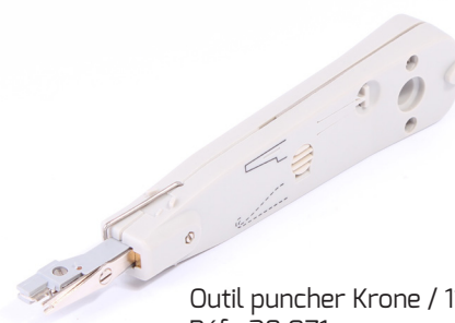
Outil puncher Krone / 110 Réf : 28 071