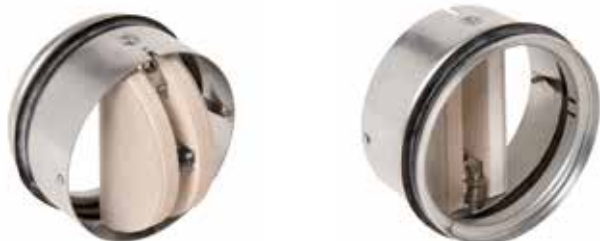
Cartouche CT avec bouche

Les Cartouches Coupe-feu CT-1 et CT-2 ont pour but d'empêcher la propagation du feu en fermant le conduit d'air au niveau de structures anti-feu, les cartouches sont utilisées à destination des bâtiments tertiaires et industriels.