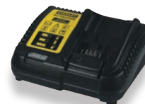
Chargeur presse e-hydraulique (HD044)