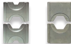
Matrices hexagonales 5T (HD032 à HD041)