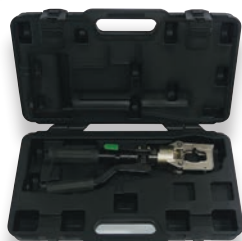
Valise pour presse HD030 (HD042)