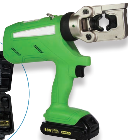
Presse e-hydraulique livrée dans sa valise (HD031)

Ces presses sont conçues pour le sertissage de manchons de jonction et de cosses. Elles existent en 2 versions : - type hydraulique, - type électrohydraulique.