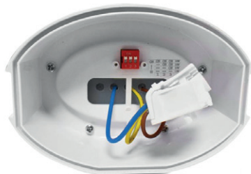
Connecteur rapide + Picot de réglage de la puissance