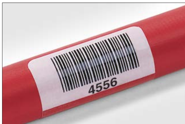
Le film transparent assure une identification durable.