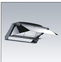
Projecteur LED CHAMPION 264L-740 V3 VSR ANT 96633217

La présente déclaration de produit environnemental (EPD) est basée selon les normes EN ISO 14025 et EN 15804 et décrit les impacts spécifiques environnementaux du produit mentionné. Cette déclaration fait suite également aux exigences spécifiques et concrètes du programme Institut Bauen und Umwelt e.V. (IBU) selon les règles de calcul des LCA et le contenu de l'EPD (de base) selon les instructions de PCR sous-jacentes (PCR: Règles de catégorie de produit) pour «Luminaires, lampes et composants pour luminaires» (Ref: IBU PCR Teil A et B). Le produit décrit sert d'unité déclarée. La déclaration inclut une description du produit, des informations sur la composition des matériaux, la production, le transport, la phase d'utilisation, l'élimination et le recyclage, ainsi que les résultats de l'évaluation du cycle de vie. Les EPD des produits de construction sont comparables uniquement si les valeurs sont calculées conformément au même PCR et des scénarios d'utilisation appropriés et obligatoires.