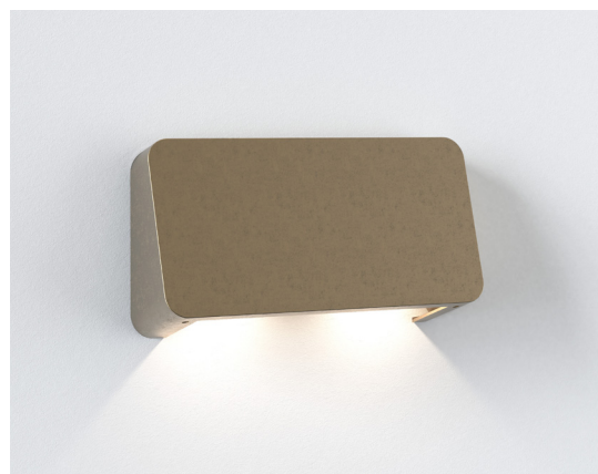
CODE: 1419006 FINISH: SOLID BRASS

THIS PRODUCT IS NOT SUITABLE FOR INSTALLATION WITHIN FIVE MILES OF THE COAST. FOR THESE ENVIRONMENTS, PLEASE FILTER PRODUCTS ON THE ASTRO WEBSITE BY 'COASTAL'.